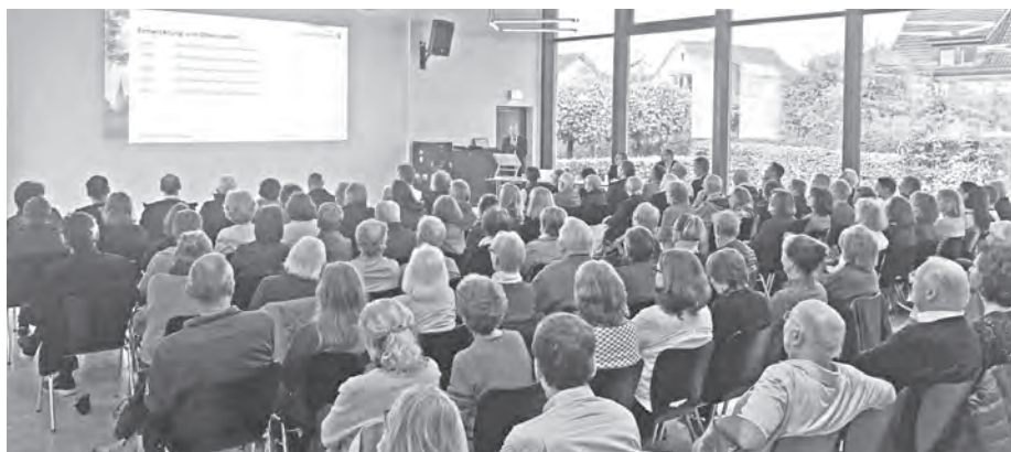
Abb. 1: Informationsveranstaltung

Angesichts der steigenden Asylquote plant die Gemeinde eine personelle Erhöhung im Sozialbereich, um die Integration der Flüchtlinge zu unterstützen. Der Gemeinderat wird nun die möglichen Optionen für die Unterbringung der Flüchtlinge weiter ausarbeiten, um die vorgeschriebene Anzahl von Asylsuchenden so schnell wie möglich aufnehmen zu können.