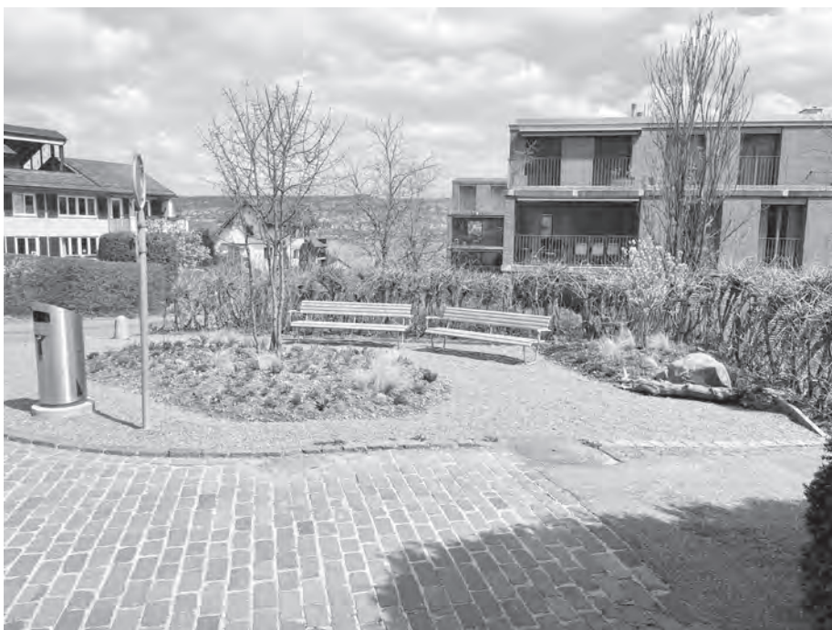
Abb. 2: Bleierplätzli