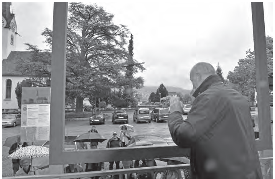
Abb. 3: Eröffnung 5+ Perspektiven Oberrieden