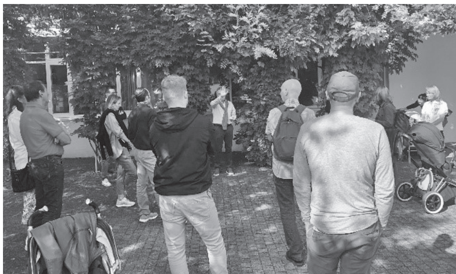
Weitere Station während Rundgang Neuzuzügeranlass.