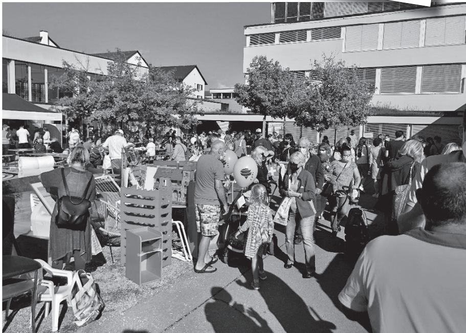
Der nächste Bring- und Holtag und der Büchermarkt werden am 10. September 2022 stattfinden.

«Die Lust an der Literatur ist auch die Lust am Leben. Die Kunst, zu Lesen, in ein Buch hineinzufallen, darin zu versinken, kaum noch auftauchen zu können, ist ein Stück Lebenskunst.»