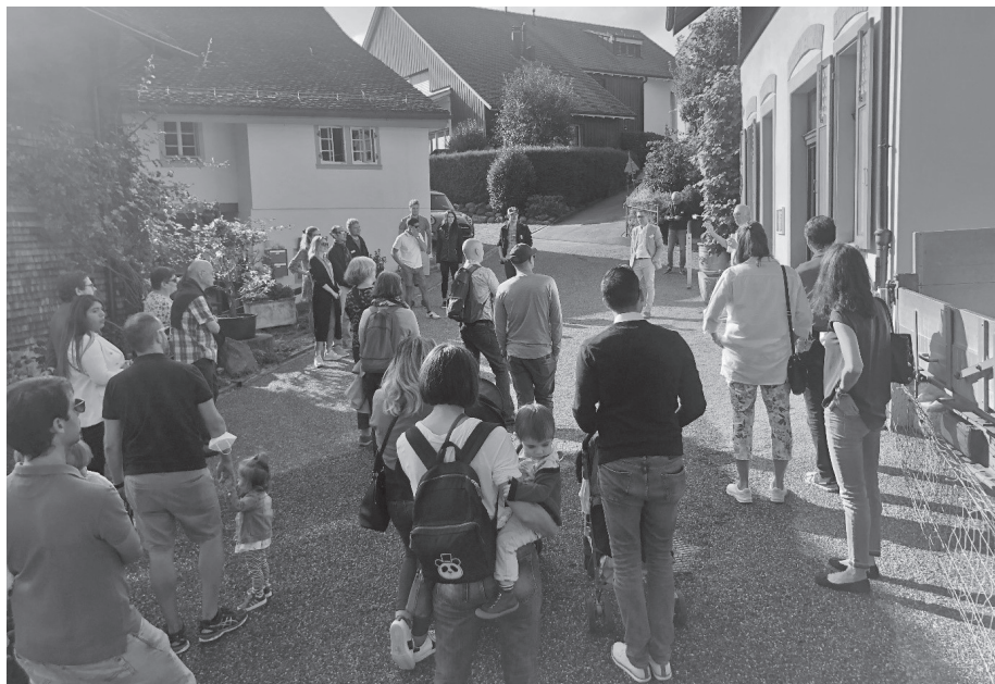
Station während Rundgang Neuzuzügeranlass.