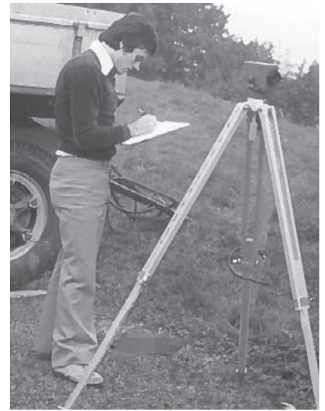
Bei der Arbeit im Jahr 1975

Erwähnenswert unter der grossen Herausforderungen und gestellten Aufgaben, welche er mit seiner Bau-