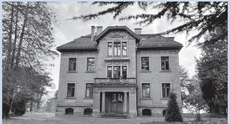
Villa Schönfels in Oberrieden – Sprachen lernen in schönem Ambiente

erwachsenenbildung@oberrieden.ch Tel. 044 722 71 08