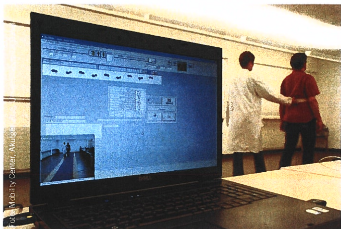
Abb. 2: Klinische spatio-temporale Ganganalyse mittels GAITRite®