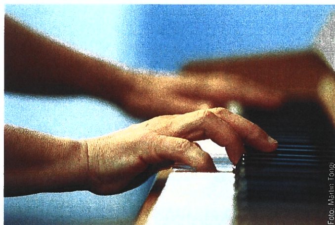
Abb. 3: Musikalische Begleitung am Klavier