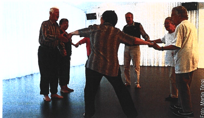
Abb. 4: Memory Atelier Jaques-Dalcroze für ältere Menschen in Basel

Aus ersten Daten in weiteren Pilotstudien konnte der Eindruck gewonnen werden, dass Demenzkranke oder Patienten nach er-