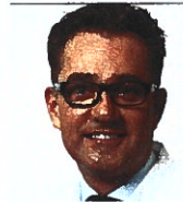
Prof. Dr. med. Reto W. Kressig Basel

ten für die Therapie einer Schenkelhalsfraktur lagen in Deutschland bereits im Jahre 2003 zwischen 27.000 – 30.000 Euro. Insbesondere wirken sich die Frakturen auf die Lebensqualität aus, bei 50% der Betroffenen führen sie zur Pflegebedürftigkeit, 20% sterben gar (9). Auch die indirekten Kosten, die durch die erhöhte Pflegebedürftigkeit entstehen, können dabei in Betracht gezogen werden. Sie werden auf das zwei- bis dreifache der direkten Kosten, die mit einem Sturz zusammenhängen, geschätzt.